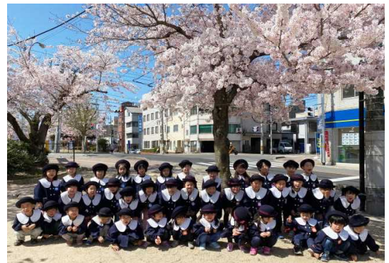
桜のお花見 こいのぼり制作